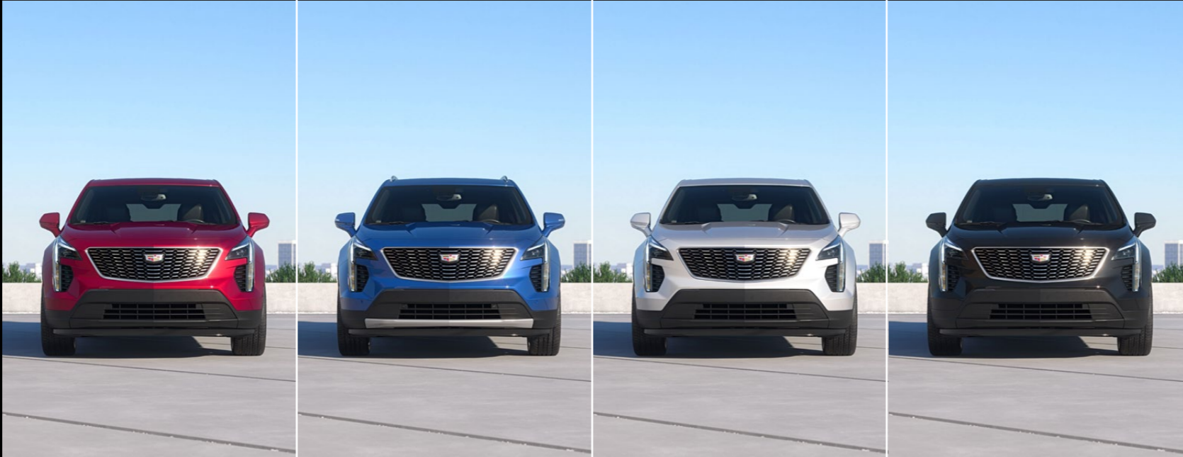
RADIANT RED METALLIC