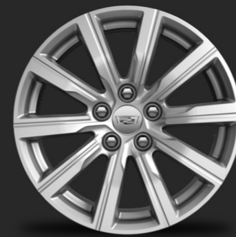
RINES DE ALUMINIO DE 18"