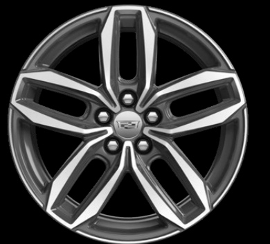
RINES DE ALUMINIO DE 20"