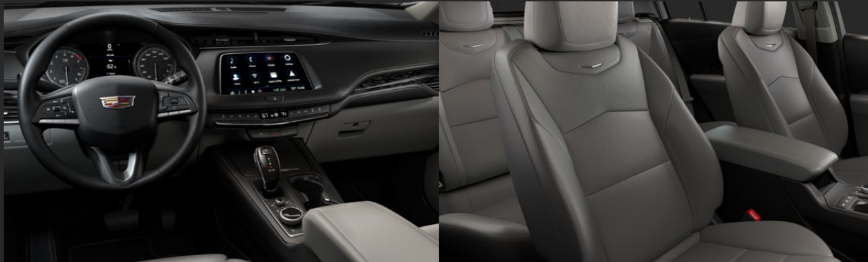
JET BLACK / LIGHT PLATINUM DISPONIBLE EN VERSIÓN PREMIUM LUXURY