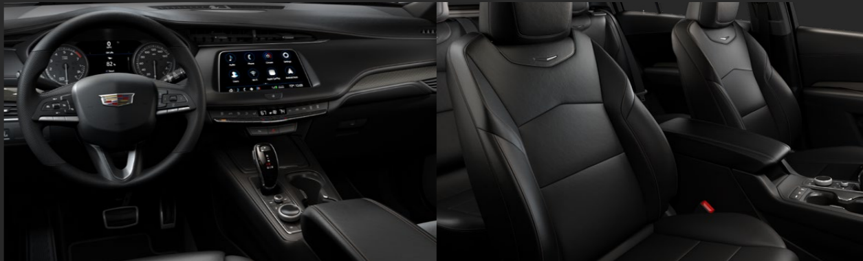
JET BLACK / CINNAMON STITCH DISPONIBLE EN VERSIÓN SPORT