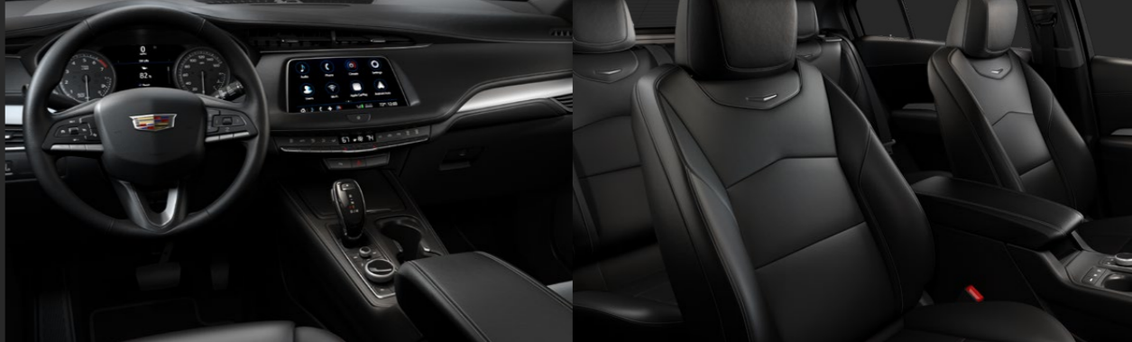
JET BLACK DISPONIBLE EN VERSIÓN PREMIUM LUXURY