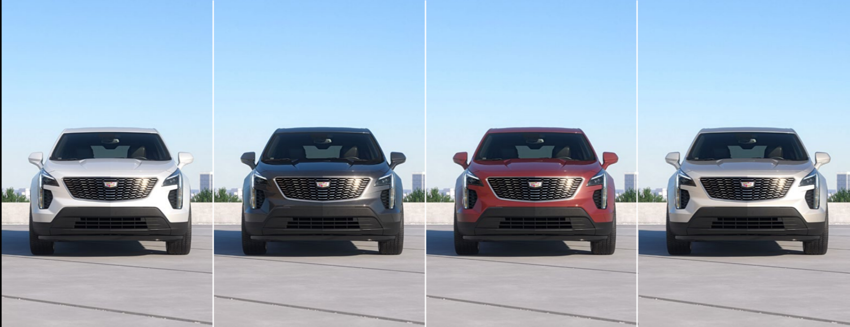
ABALONE WHITE TRICOAT