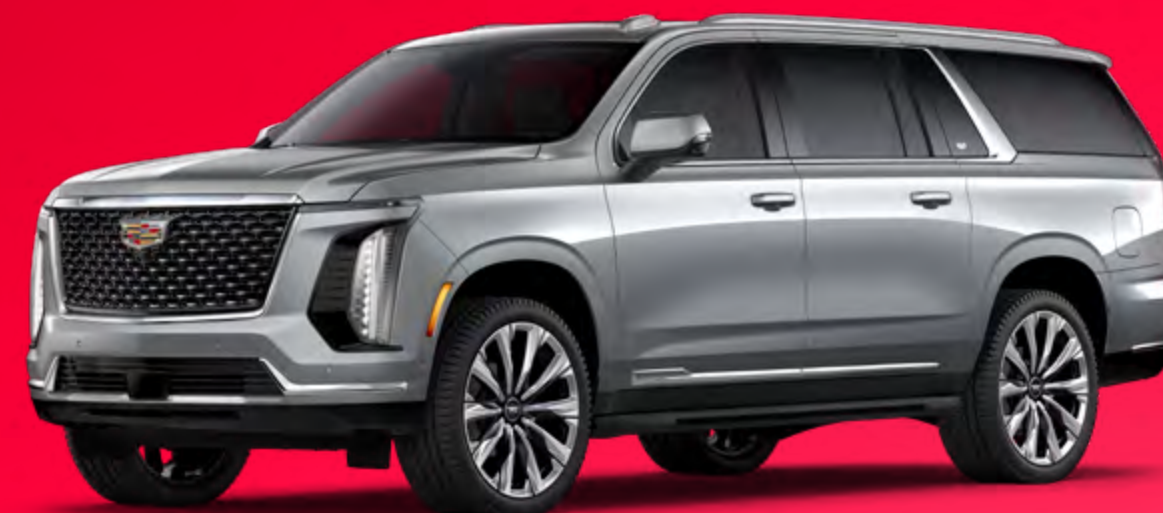
Cadillac ESCALADE® ESV