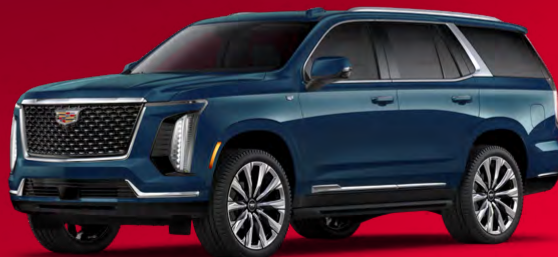
Cadillac ESCALADE® SUV