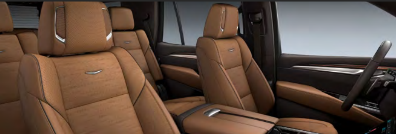
VERY DARK ATMOSPHERE / BRANDY