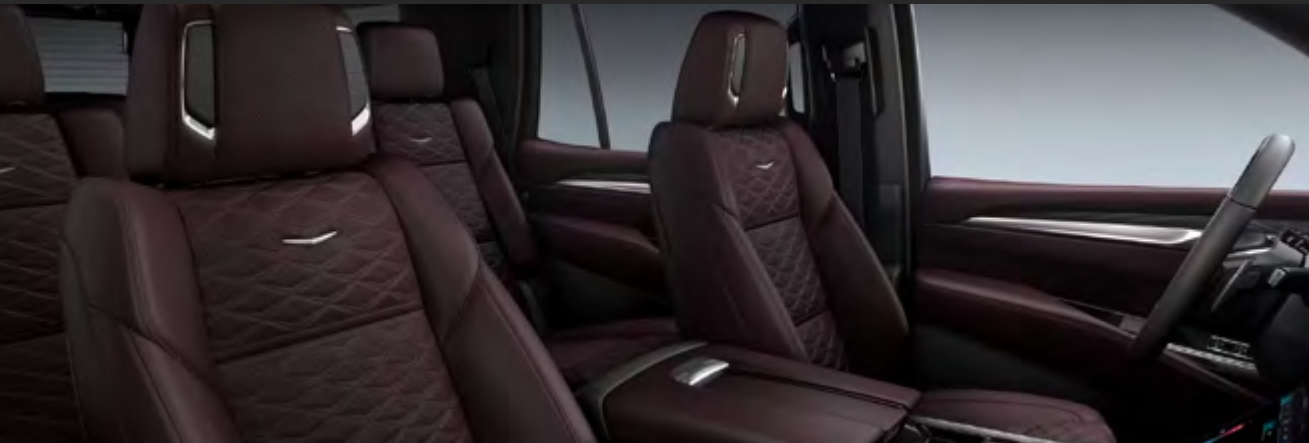
JET BLACK / RENAISSANCE RED